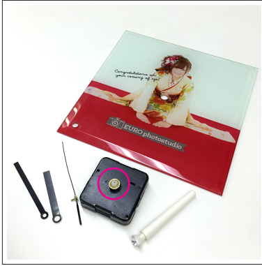
①掛け時計のパーツは上図の通りです。 金のねじを外してください。