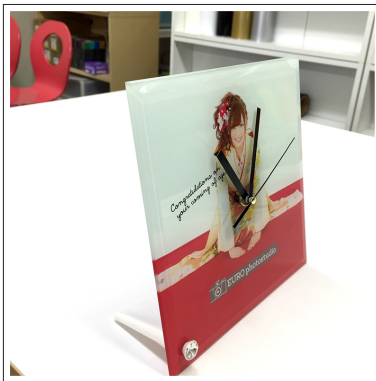
⑦スタンド用のパーツを取り付けます。