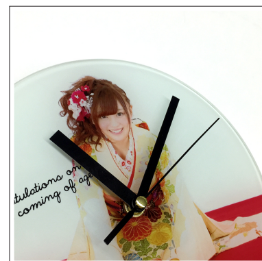
⑦秒針を取り付けます。