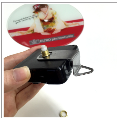
②四角いパーツに銀のフックを取り付けます。 向きにご注意ください。