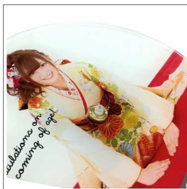
④表側から金のねじをつけパーツを時計に固定します。