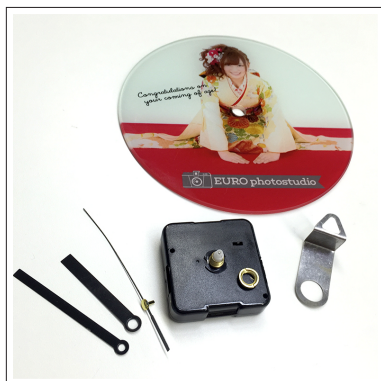
①置き時計のパーツは上図の通りです。