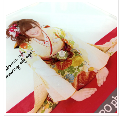
③表側から①で外した金のねじをつけ パーツを時計に固定します。