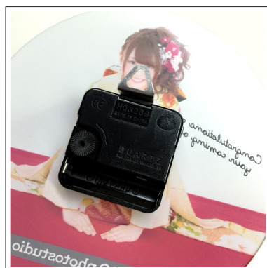
③印刷した時計の裏側に時計のパーツを セットします。