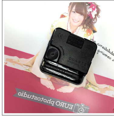
②印刷した時計の裏側に時計のパーツを セットします。