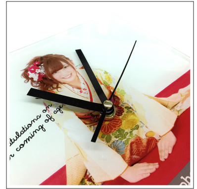
⑥秒針を取り付けます。