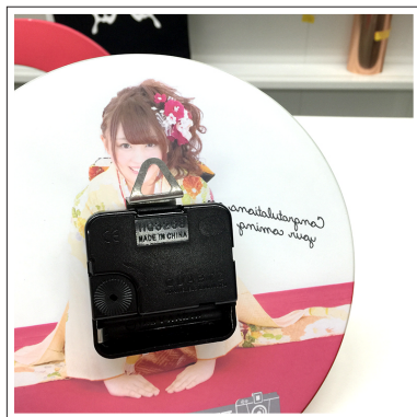
⑧電池は別売です。動作を確認してください。