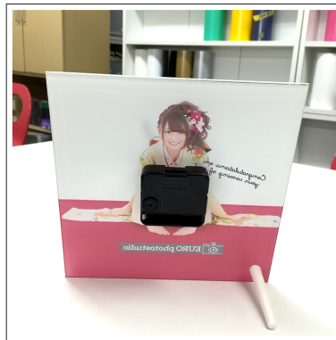
⑧電池は別売です。動作を確認してください。